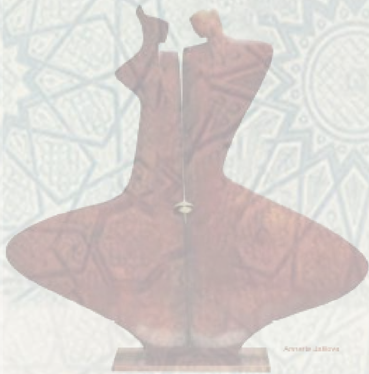
Armerie da Bivona